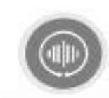
编译器 毕昇编译器