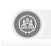
集群管理平台 多璜调度器