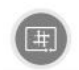
通信库 Hyper MPI