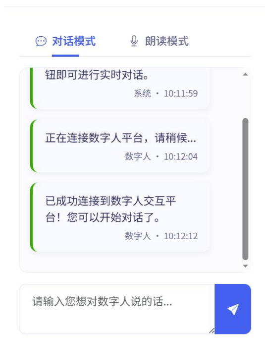
图 2-2 文本输入模式

3. 交互控制模块：打造简洁易用的交互控制面板，包含“开始连接”“录制中”等状态标识，用户一键点击即可开启数字人实时对话，同时支持交互过程录制，便于企业后续复盘、质检与数据分析。