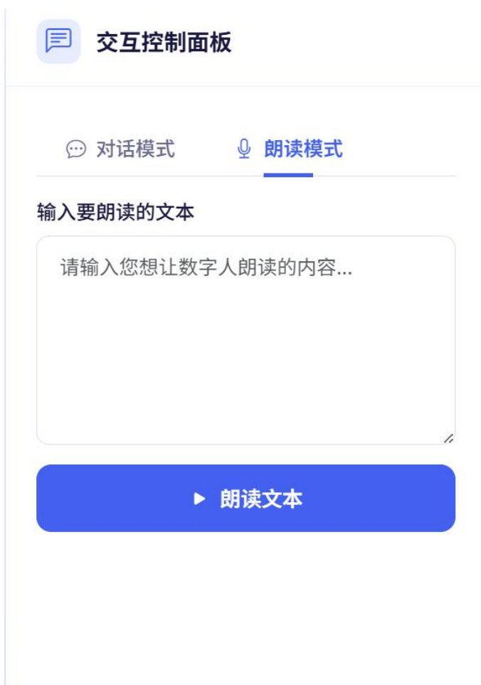
图 2-1 语音输入模式

(2) 文本输入：提供文本输入框，支持用户输入需朗读或咨询的文本内容，数字人可快速响应并完成文本朗读、问题解答，满足静音环境、文字精准传达等场景需求。