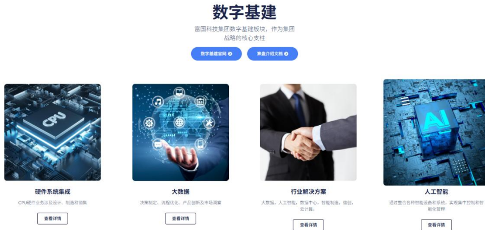
图 4-2 富国科技集团数字基建板块