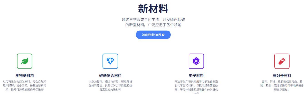
图 4-3 富国科技集团新材料板块